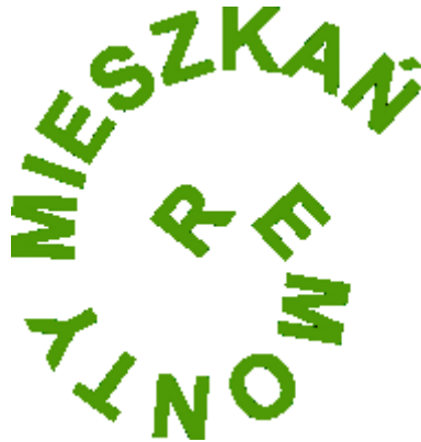
Obraz 1b. Logotyp