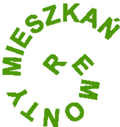
Obraz 1b. Logotyp

Przy pomocy programu do obróbki grafiki wektorowej wykonaj projekt logo firmy. Swoją pracę udokumentuj zrzutem ekranowym. Wykonaj następujące czynności: